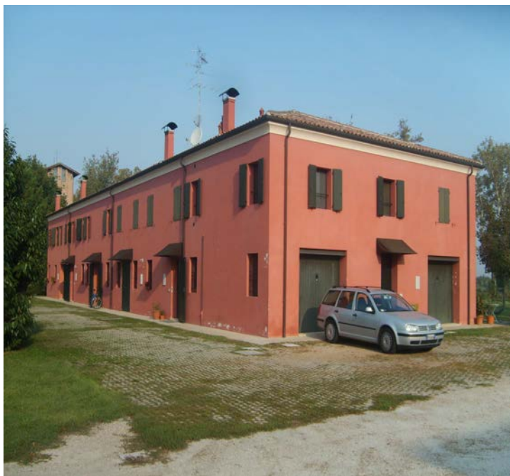
Restauro di fabbricati per ricavo di alloggi, presso la località Masi Torello (FE) Corte Paglierina