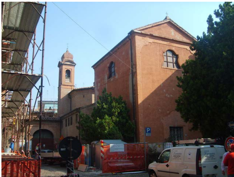
Manutenzione straordinaria della Chiesa di Santa Giustina adiacente ai lavori di Restauro del complesso ex convento di S. Giustina in P.zza Cortebella Ferrara