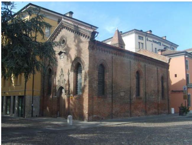
Manutenzione ordinaria Chiesa di S. Giuliano in Ferrara P.tta Repubblica (FE)