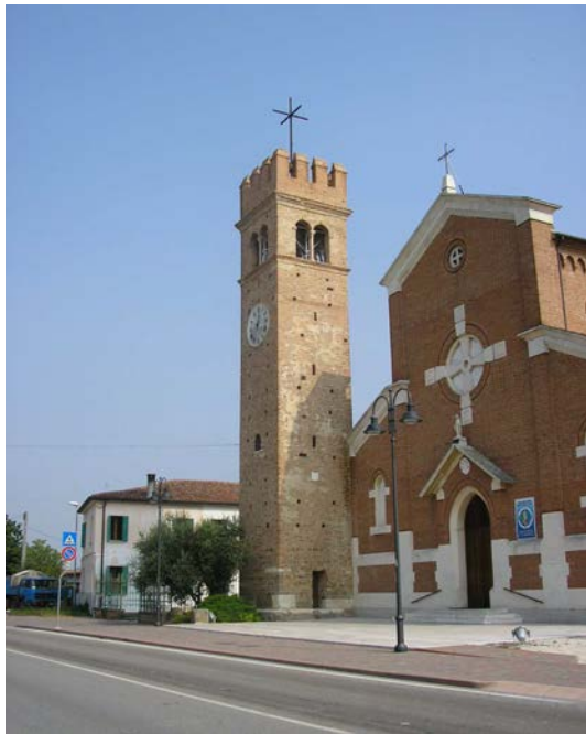
CHIESA PARROCCHIALE "San Gallo" Urbana(PD) - Torre Campanaria - Lavori di restauro e risanamento conservativo