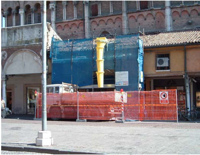
Manutenzione ordinaria esterna delle volte degli annessi al Duomo di Piazza Trento Trieste in Ferrara