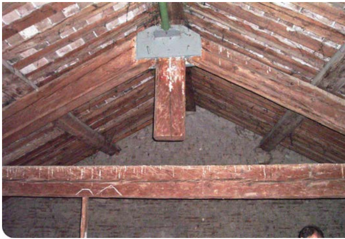
Restauro strutturale degli annessi del complesso di San Benedetto in Ferrara