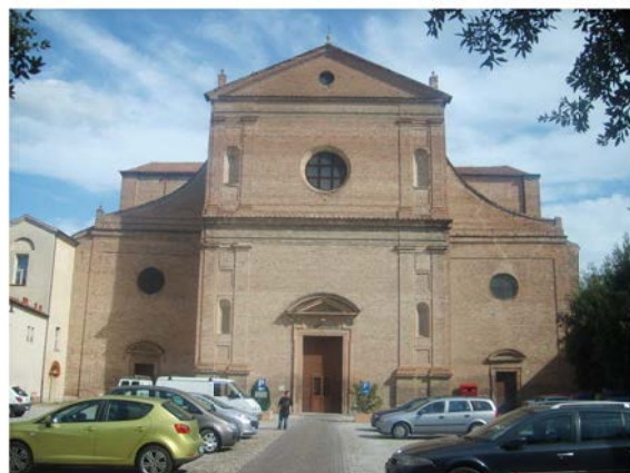
Manutenzione straordinaria, intervento di recupero sul manto di copertura della Chiesa di Santo Spirito in Via Della Resistenza 5 Ferrara