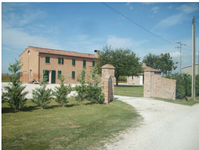
Ristrutturazione con ricavo unità immobiliari, Via della Chiesa 63-65 Ferrara