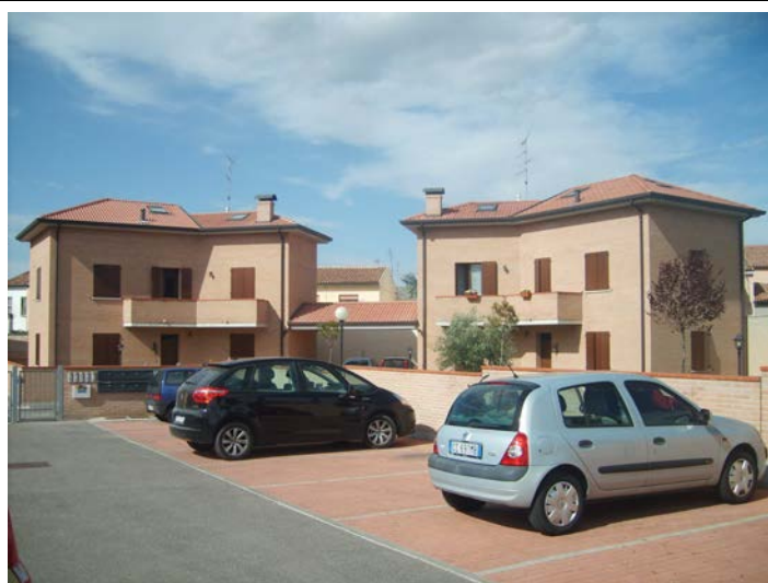
Costruzione di di palazzine per alloggi in Pontegradella (FE),