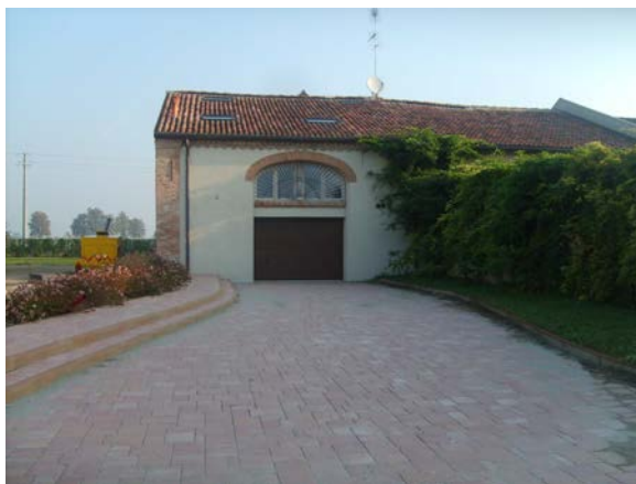
Risanamento conservativo di tipo "B" per ricavare due abitazioni agricole in Via dei Calzolari 255 di FERRARA.