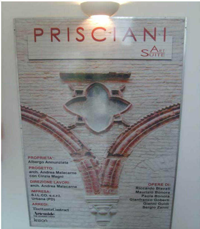
Restauro del Palazzo storico Prisciani adibito a Art Suite ed Hotel Annunziata P.zza della Repubblica 5 (FE)