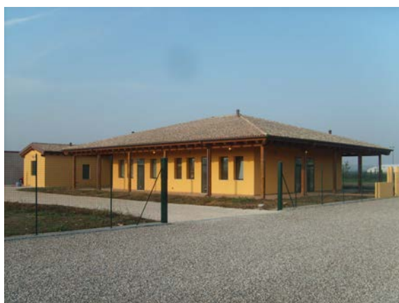
Nuova costruzione complesso destinato ad allevamento pensione ed addestramento cani in Via dei Calzolari 255 Francolino (FE)