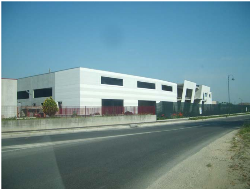
Realizzazione di struttura industriale in Via Arti e Mestieri Urbana (PD)